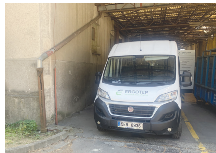
Foto: dodávka s pomocí