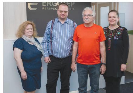
Foto: tým sociální služby v roce 2021