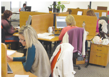
Foto: administrativní centrum v roce 2013