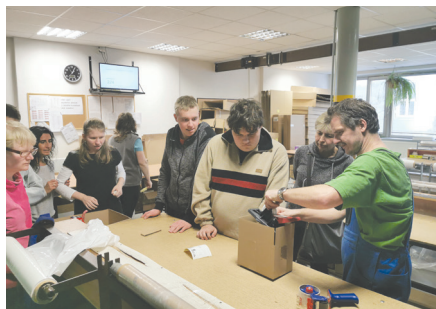
Foto: praktikanti ve skladu Viledy

Hlavním cílem projektu bylo zvýšení zaměstnatelnosti absolventů se zdravotním postižením a absolventů s nižším středním odborným vzděláním ze speciálních a praktických středních škol v Královéhradeckém kraji prostřednictvím aktivit zaměřených na získání pracovních návyků a zkušeností, a také propojení speciálních a praktických středních škol a podniků zaměstnávajících osoby se zdravotním postižením, případně podniků na volném trhu práce, a k navázání jejich dlouhodobé spolupráce.