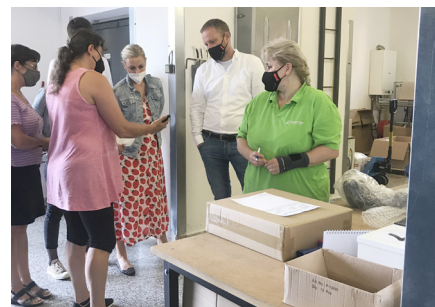
Foto: distribuce v Havlíčkově Brodě

ným e-shopům? Především v myšlence a přístupu k ekologickému balení – budeme recyklovat staré obaly a použitým věcem budeme dávat druhou šanci.